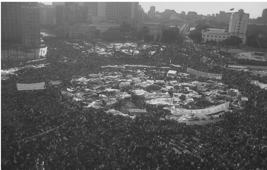
Foto: Tahrir-Platz am 8.2.2011

Am 11. Februar 2011 erhielt ich in Kairo per SMS die Nachricht eines Freundes aus Beirut mit den Worten: „Die Revolution marschiert, ich bin stolz ein Araber zu sein“. Aufbruchstimmung herrschte, Zuversicht. Die Menschen in der Region waren geprägt von Vertrauen in ihre eigene Kraft, das Rad der Geschichte herum-drehen zu können. Die Angst, das Minderwertigkeitsgefühl waren vorbei. Tunesien hatte es vorgemacht, Ägypten stand auf der Schwelle, endlich bewegten sich die Menschen!