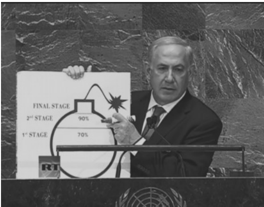
Foto: Netanyahu vor der UNO-Vollversammlung am 29.09.2012. In der Mitte seiner Rede zog er eine Cartoon-Bombe und einen roten Stift hervor.

„Next Stopp Teheran“ riefen damals besonders kriegsbegeisterte Amerikaner. Heute scheint der Punkt näher zu rücken, dass ihre Träume wahr werden. Die Kriegstrommler sind auf dem Vormarsch. Sie sitzen vor allem in der israelischen Regierung.