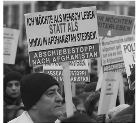
Foto: Afghanistan-Demo am 7.1.2017 in Frankfurt a.M.

Das AZR ist aus vielen Gründen eine statistische Wundertüte, dessen Rohdaten nicht geeignet sind, die Propaganda vom Vollzugsdefizit ohne dif-