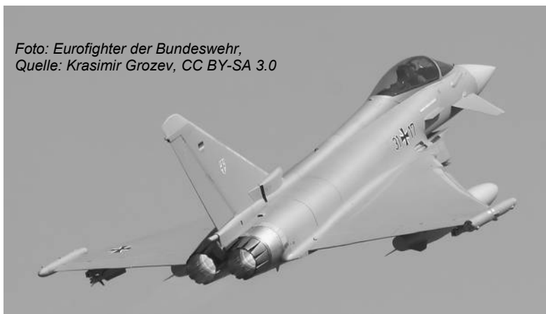
Foto: Eurofighter der Bundeswehr

über ihren italienischen Ableger Rheinmetall Italia sowie ihre italienische Tochterfirma RWM Italia in den Jahren 2014 und 2015 Rüstungsprodukte im Wert von 71,5 Millionen Euro an Riad verkauft. All dies ist in den deutschen Rüstungsexportberichten nie aufgetaucht.