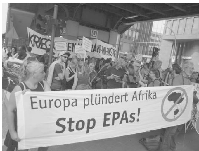
Foto: Transparent bei den Protesten gegen den G20-Gipfel

Explizit friedenspolitische Forderungen finden sich dabei nur an fünf Positionen: Keine US-Atomwaffen in Deutschland (Nr. 30), keine Waffenexporte außerhalb der EU (Nr. 40), keine Erhöhung der deutschen Rüstungsausgaben (Nr. 48), keine Kriegseinsätze der Bundeswehr (Nr. 49) und Waffenproduktion in Deutschland einschränken (Nr. 53).