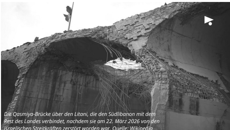
Die Qasmiya-Brücke über den Litani, die den Südlibanon mit dem Rest des Landes verbindet, nachdem sie am 22. März 2026 von den israelischen Streitkräften zerstört worden war, Quelle: Wikipedia

„Rettungskräfte suchen weiter unter den Trümmern ... die Chancen, Überlebende zu finden, sind verschwindend gering ... Angehörige treffen ein, um nach ihren vermissten Angehörigen zu suchen ... Beiruts Stadtteil Tallet al Khayat – mindestens 200 Tote bei israelischen Angriffen innerhalb von zehn Minuten am Mittwoch.“