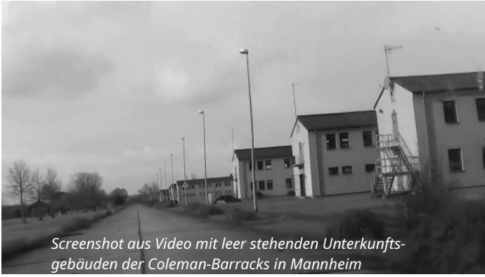
Screenshot aus Video mit leer stehenden Unterkunftsgebäuden der Coleman-Barracks in Mannheim

Das Redaktionsnetzwerk Deutschland (RND) veröffentlichte am 25.3.2026 mit dem Titel „Kasernen statt Wohnungen“ mehrere Beiträge mit eigenen Recherchen über 200 alte Militärgrundstücke in Deutschland, die für die Bundeswehr reaktiviert werden sollen. Dieser Stopp von Plänen zur zivilen Nutzung wurde bereits im Herbst letzten Jahres von Boris Pistorius veranlasst. Das RND zitiert dazu aus einem Brief von Pistorius an eine Linken-Abgeordnete, worin es heißt: