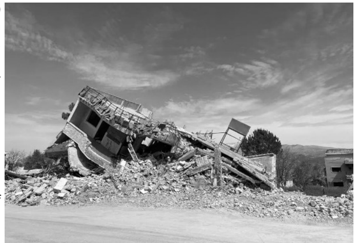
Man stelle sich das einmal vor: Die Armee eines Nachbarstaates warnt uns und zerbombt kurze Zeit darauf das Haus, in dem die eigene Familie seit Generationen gewohnt hat ... Israel tut das im südlichen Libanon (im Bild in Khiam) – und die Welt schaut zu. (Text: Globalbridge.ch vom 7.4.26)

„Wir sind friedvolle Leute“, sagt ihr Vater im Gespräch mit der Autorin. Mais al Jabal liege genau an der „Grenze“. Seine Tochter Zahra übersetzt souverän, dass er der Regierung