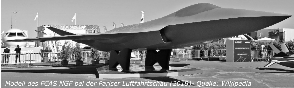
Modell des FCAS NGF bei der Pariser Luftfahrtschau (2019)

Berlin und Paris zögern das schon sicher geglaubte Scheitern ihres Kampfjetprojekts Future Combat Air System (FCAS) weiter hinaus.