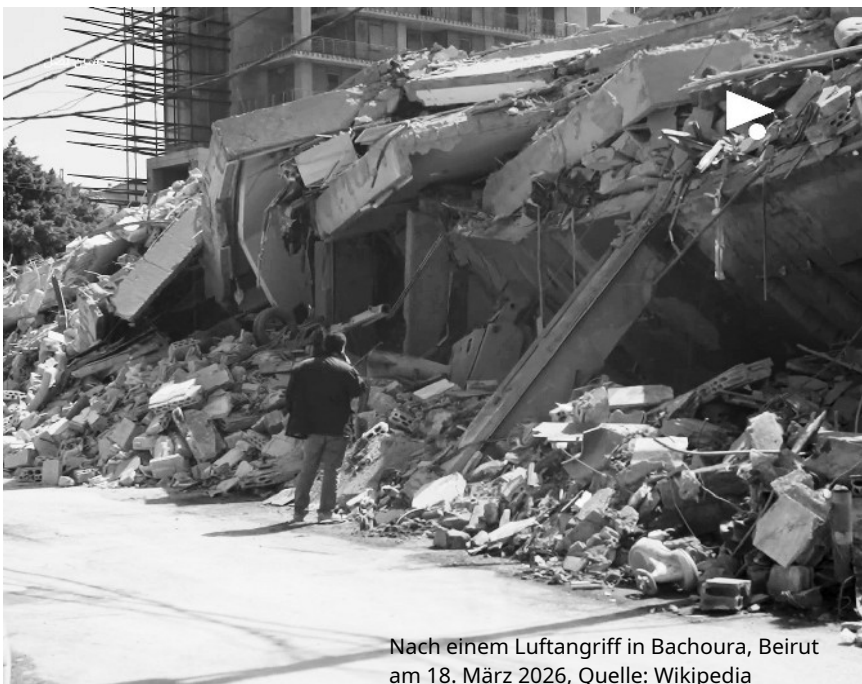
Nach einem Luftangriff in Bachoura, Beirut am 18. März 2026

Ich fordere Israel nachdrücklich auf, diesen Befehl zurückzunehmen und den Schutz aller Gesundheitseinrichtungen, des medizinischen Personals, der Patient*innen und der Zivilbevölkerung zu gewährleisten.“