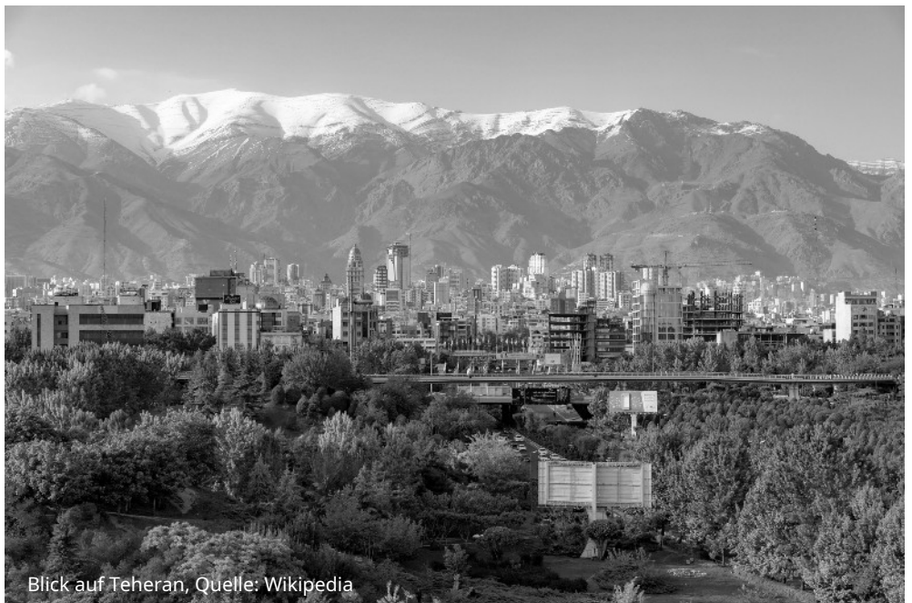
Blick auf Teheran

Selbst die Islamische Republik ist ein hybrides System: gleichzeitig ein Nationalstaat und eine Demokratie westlicher Prägung, eine Republik, die aus der konstitutionellen Revolution von 1906 hervorgegangen ist, eine imperiale Macht, die in einer jahrtausendealten Regierungstradition verwurzelt ist, und ein System religiöser Führung (Imamokratie